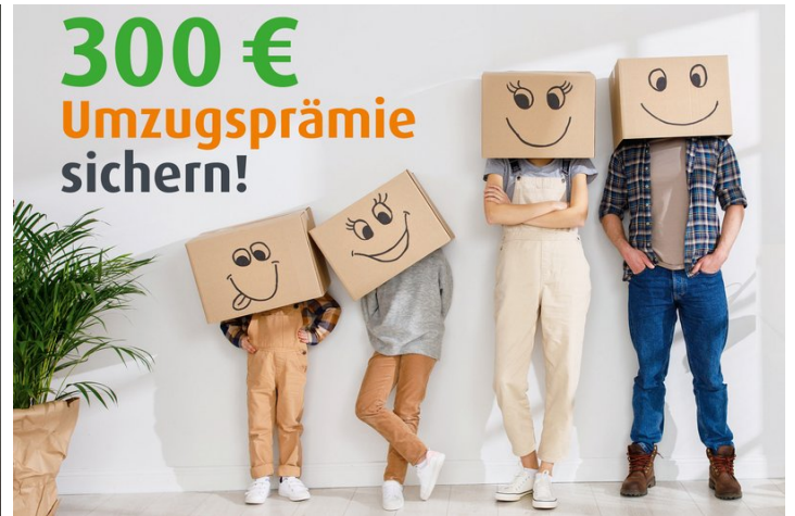
Umzugsprämie der WGS