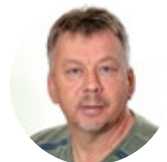
Riego Wramp Service