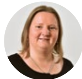
Karolin Ruder Service, Gästewohnungen

Telefon: 03723 6292-13 E-Mail: uhlig@wg-sachsenring.de