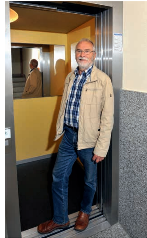
◀ Am Großblock Südstraße 23 - 32 werden zehn Aufzüge angebaut